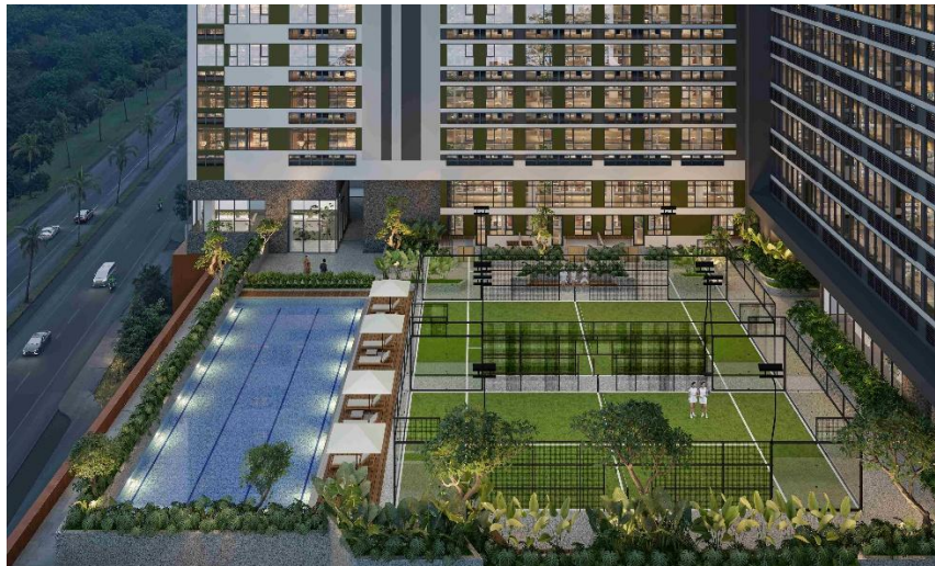
Foto: Ilustrasi Padel by The Pool di Collins Boulevard, Serpong

Gaya hidup sehat kini jadi bagian dari Collins Boulevard.